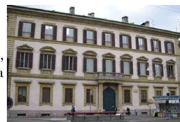
Sede EPAM Unione Confcommercio